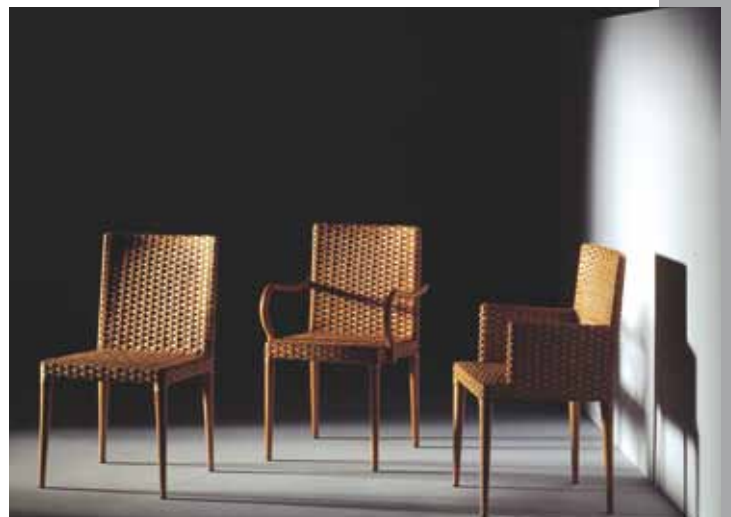
Stuhl: Tom 8420 · Stuhl: Tom 8422 · Stuhl: Tom 8424 Geflecht: Peddigrohr · Farbe: virginia

Mit exakten Proportionen unterstützt Tom das Sitzen. Das eröffnet die Flexibilität, die zum Verweilen einlädt. Und weil Sitzen eine individuelle Angelegenheit ist, kann sich Tom an Sitzvorlieben anpassen. Mit niedrigem oder hohem Rücken, mit oder ohne Armlehnen oder mit unterschiedlichen Sitzhöhen.