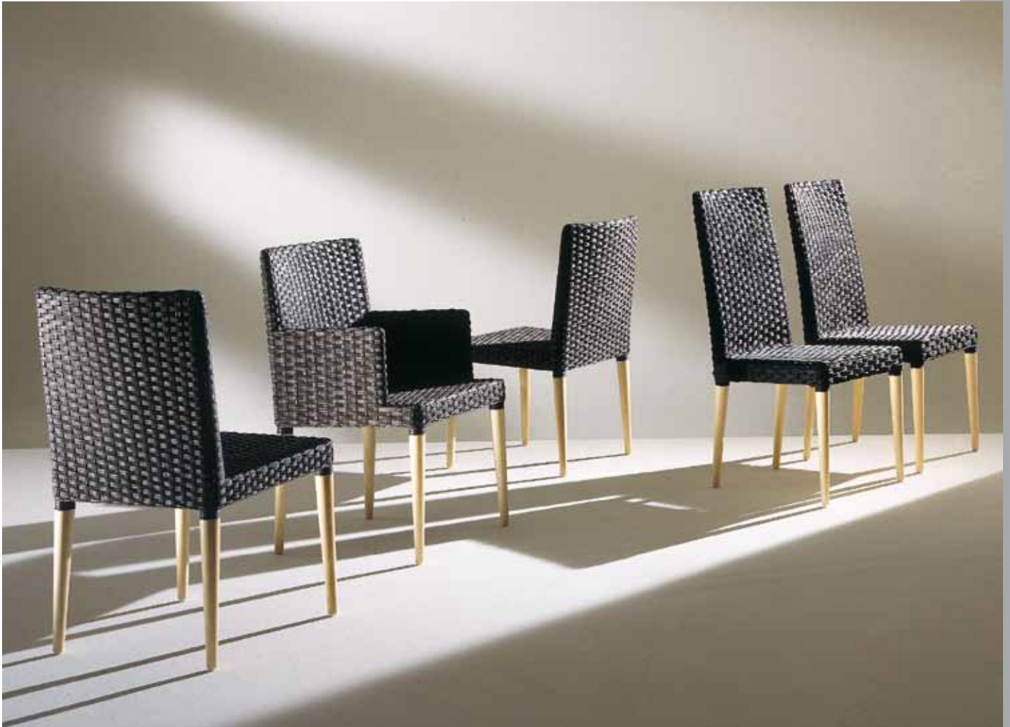
Stuhl: Tom 8420 · Stuhl: Tom 8424 mit ausgeflochtener Armlehne · Stuhl: Tom 8425 Hochlehner Geflecht: Peddigrohr · Farbe: nero