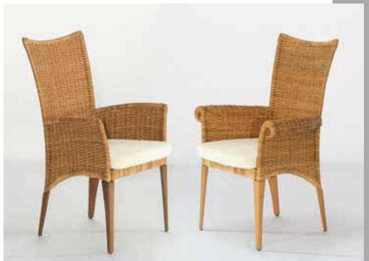
Stuhl: Classic 8075 · Stuhl: Classic 8079 Geflecht: Boondoot · Farbe: natur gewachst

Flecht-Tradition zeitlos interpretiert. Das Stuhlprogramm Classic mit der komfortablen hohen Rückenlehne bietet Variantenreichtum durch vielfältige Details. Mit oder ohne Armlehne. Mit unterschiedlichen Beinvariationen. In Boondoot- oder Peddigrohr sowie einer Vielzahl von Farben.