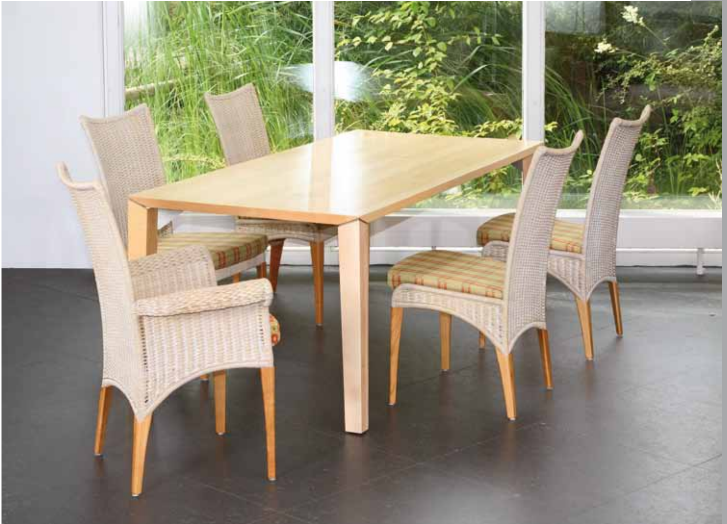
Stuhl: Classic 8079 mit geschwungener Armlehne · Stuhl: Classic 8071 Geflecht: Peddigrohr · Farbe: sandweiß gewischt